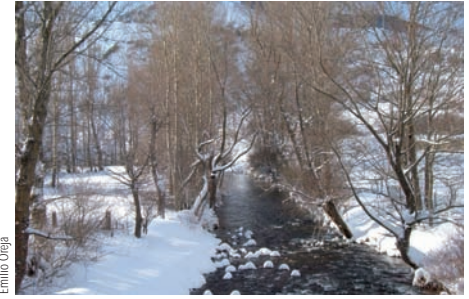
Torrente de montaña